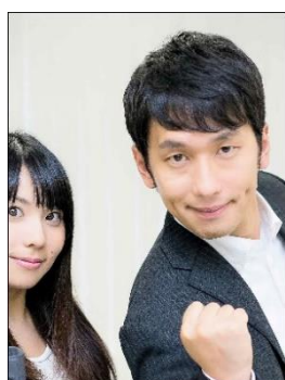
✗ Chụp cùng người khác