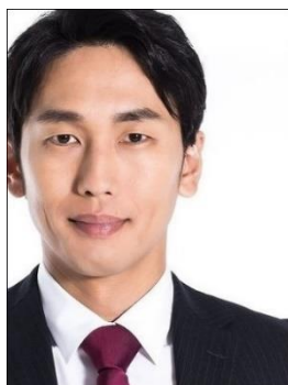
✗ Mất một phần mặt