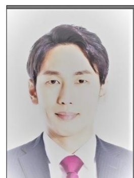
✗ Ảnh chụp lại ảnh khác