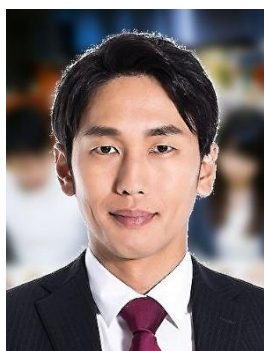
✗ Phong nền có lẫn hình ảnh khác