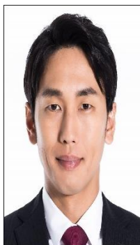
✗ Chiều ngang và dọc không cân đối