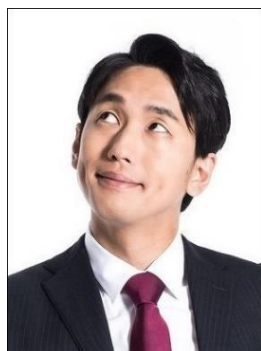
✗ Mắt nhìn hướng khác