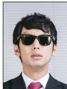
✗ Đeo kính râm