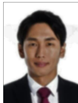
✗ Không rõ mặt