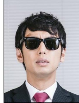
× サングラスをかけている