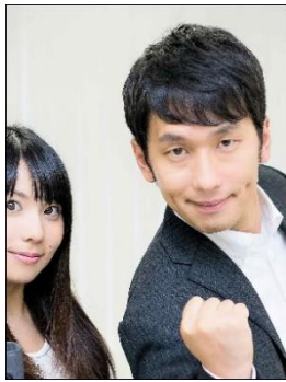
× ほかのひとと写っている