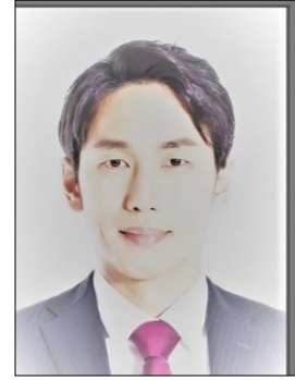
× 写真を撮影している