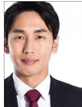
× 顔の一部が切れている