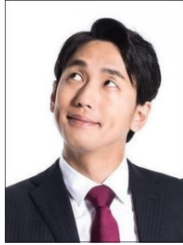
× 視線を外している