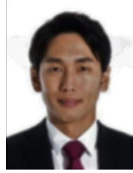
× 暗く不鮮明である